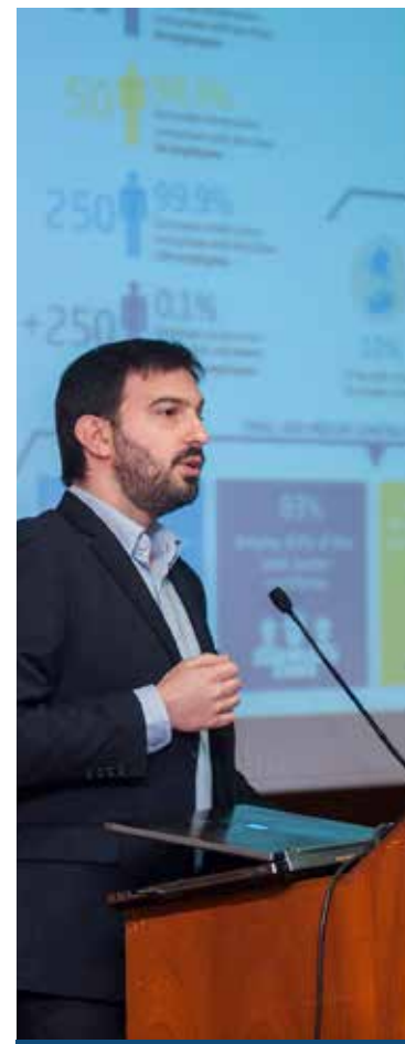
EBC toma la palabra en la Cumbre europea sobre BIM - Barcelona, febrero 2016