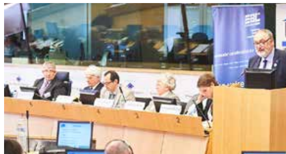
Seminario conjunto de EBC y UIPI "Renovar las viviendas privadas: ¿es el Plan Juncker una solución?" - Bruselas, marzo 2016

agregado al financiamiento de la eficiencia energética. El proyecto piloto francés "Picardie Pass Renovation" fue presentado como una pista para utilizar este plan de inversión; constituye un buen ejemplo de cómo los fondos europeos pueden beneficiar conjuntamente a los propietarios inmobiliarios y las PYME de la construcción. El proyecto apoya modelos empresariales innovadores como la reagrupación de empresas constructoras .