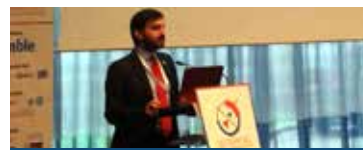
EBC habla en el marco de GeoBIM Europe 2015 - Amsterdam, diciembre 2015

se debatió sobre cómo garantizar que la pequeña y mediana empresa saque provecho de BIM (Building Information Modelling). Varias facetas de BIM fueron presentadas: las últimas innovaciones, los problemas para capacitar a los empresarios de la construcción, la utilización de BIM para la contratación pública y los pequeños proyectos de renovación de edificios.