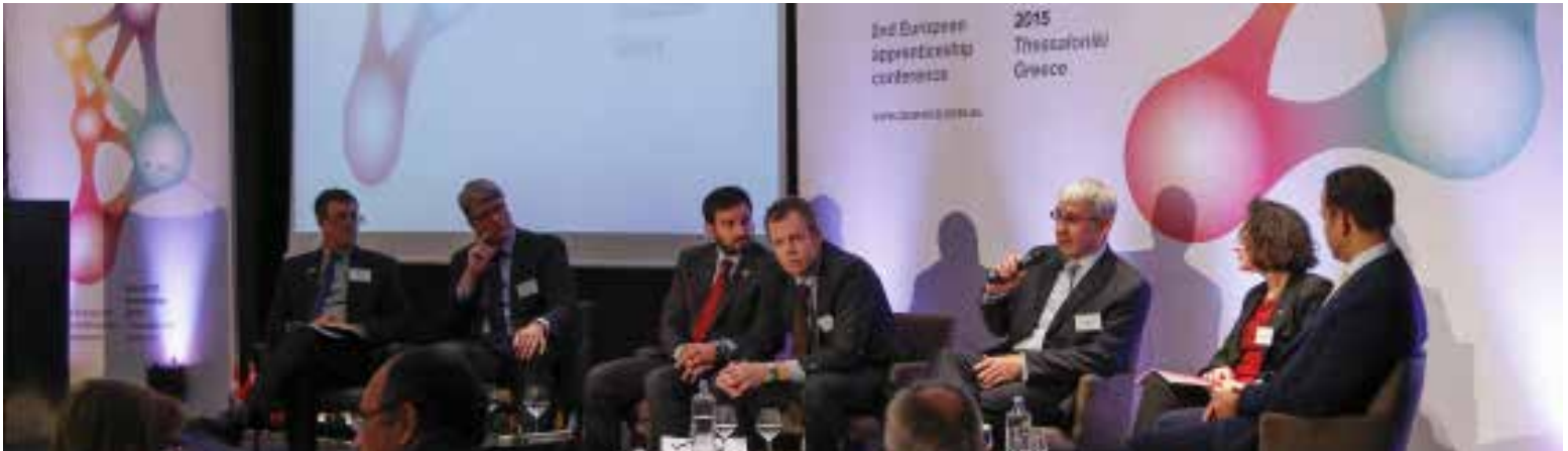
EBC toma la palabra en la conferencia Cedefop "Comprometer las PYME con el aprendizaje: convertir ideas en realidad" - Salónica, noviembre 2015