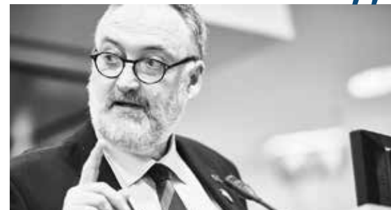
EBC habla en el marco de la Asamblea anual de EuPC "La innovación cumple con los requisitos de la economía circular" - Lyon, junio 2016